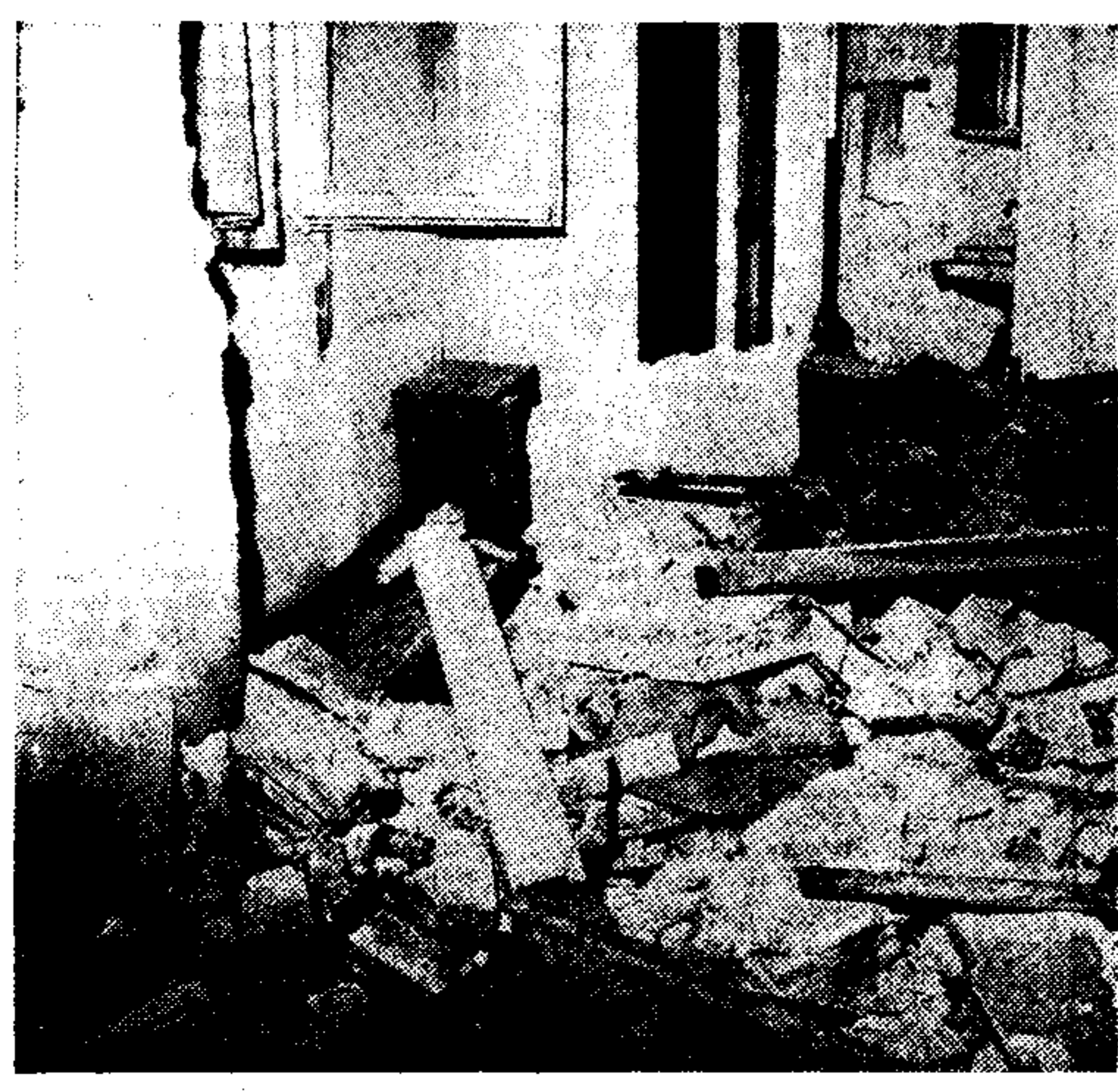
Τό δωμάτιο του ξενοδοχείου 'Αριστείδης', όπου σκοτώθηκε ο 'Ιορδανός Μόσα 'Αμπντούλ Ζεάντ Μοσά. Η αίθουσα είναι ερειπωμένη για τήν λαγή της έκρηξης.