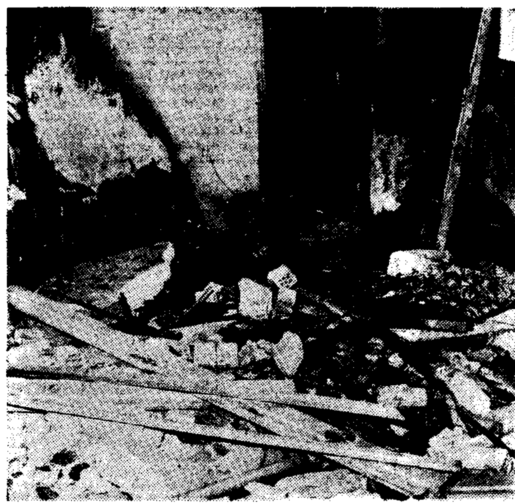
Μία άδεια φωτογραφία από τό δωμάτιο, όπου έθηκε ολέθρο θάνατο ο 'Ιορδανός. Τά πάντα είναι ανεγίρματα και άσχετα από τήν έκρηξη.